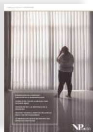
Revista NPunto. Volumen II. Número 17

Con tu asistencia podrás beneficiarte de publicar en la revista para profesionales de la salud NPunto .