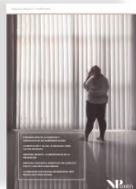
Revista NPunto. Volumen II. Número 17

Con tu asistencia podrás beneficiarte de publicar en la revista para profesionales de la salud NPunto .